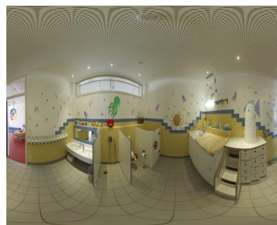
Bad der Füchse

Im Erdgeschoss befinden sich die Gruppenräume, Küche, Personaltoilette und das Büro der Leitung.