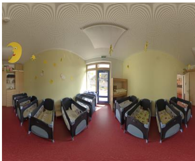
Schlafraum der Füchse